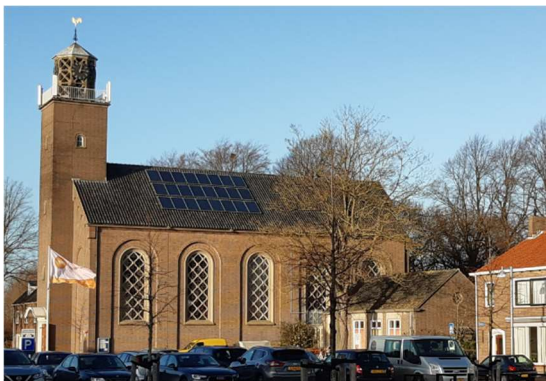
Zonnepanelen op daken en op het erf

In Sluis wordt er al zo'n 120 TJ aan groene energie opgewekt; door de windmolens bij Hoofdplaat en door zonnepanelen op daken van huizen en bedrijven. Extra zonnepanelen op meer daken en op bedrijventerreinen zou nog eens zo'n 100 TJ kunnen opleveren. Dan zitten we al op het doel.