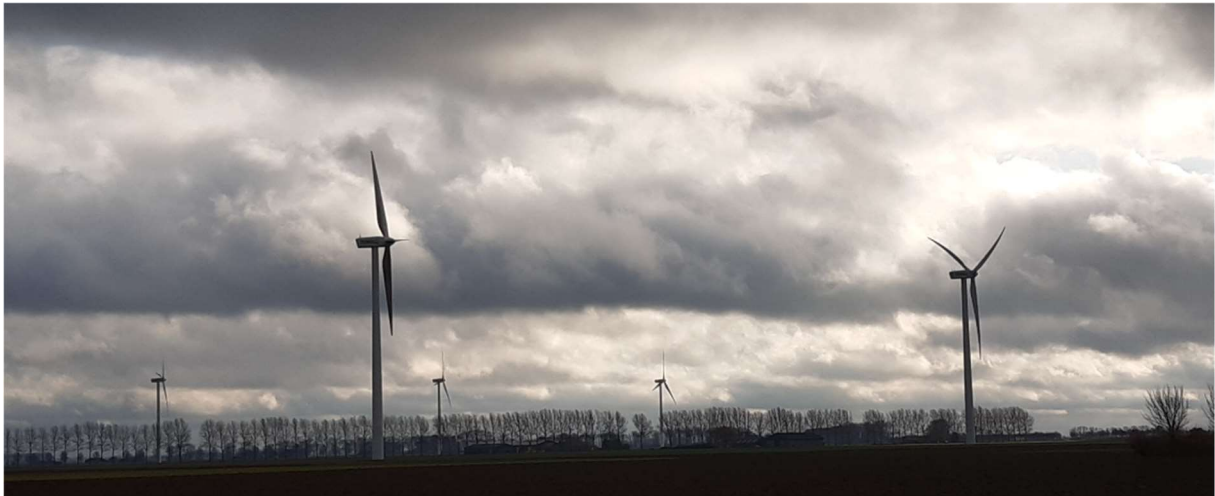
De windturbines bij Hoofdplaat

Duidelijk is dat ons ambitieniveau en solidariteitsprincipes, een grote impact hebben op wat er nodig is aan zonneweides en dergelijke. Hoe groen willen we zijn?